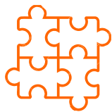
Listo para instalar